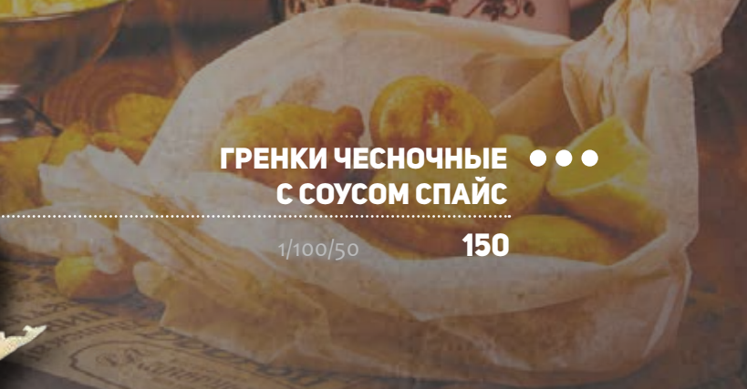
ГРЕНКИ ЧЕСНОЧНЫЕ ●●● С СОУСОМ СПАЙС 1/100/50 150