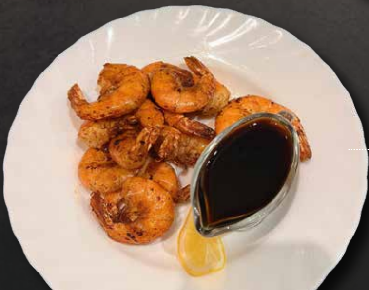
КРЕВЕТКИ ЖАРЕННЫЕ ●●● С ЧЕСНОКОМ 1/150/30 650